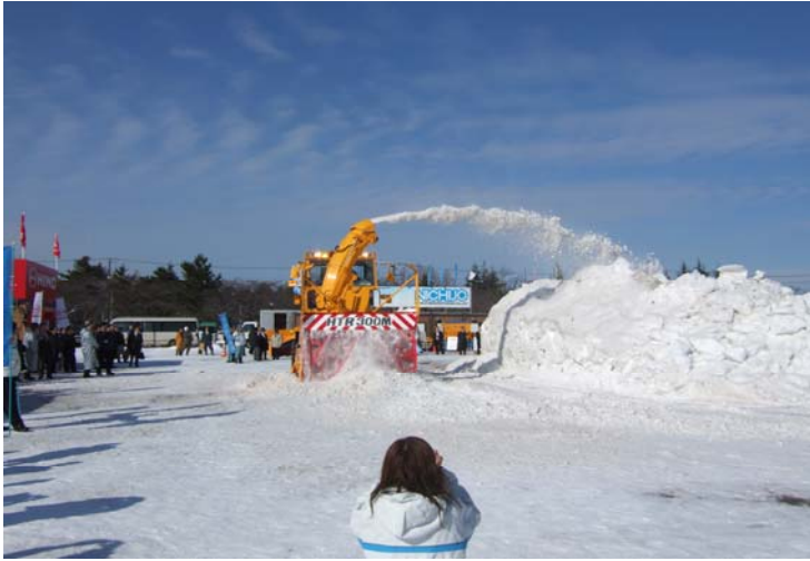
除雪機械実演会状況