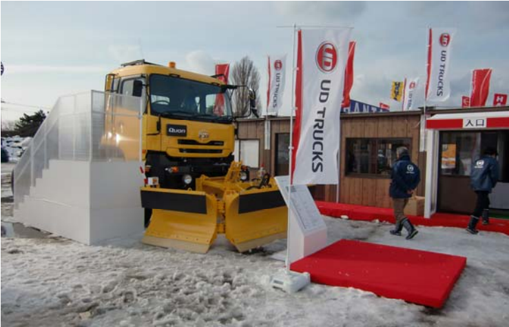
UDトラック(株)会場展示品 大型除雪トラック 10t級 6×6 折りたたみ式アングリングプラウ付