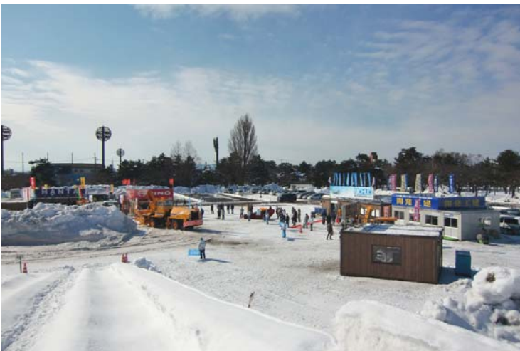
展示・実演会場全景(1/2)