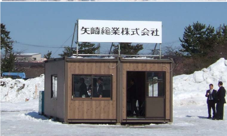
矢崎総業(株)会場展示品 建設機械施工管理システム 長時間記録型ドライブレコーダー テレマテックシステム 新施工管理システム