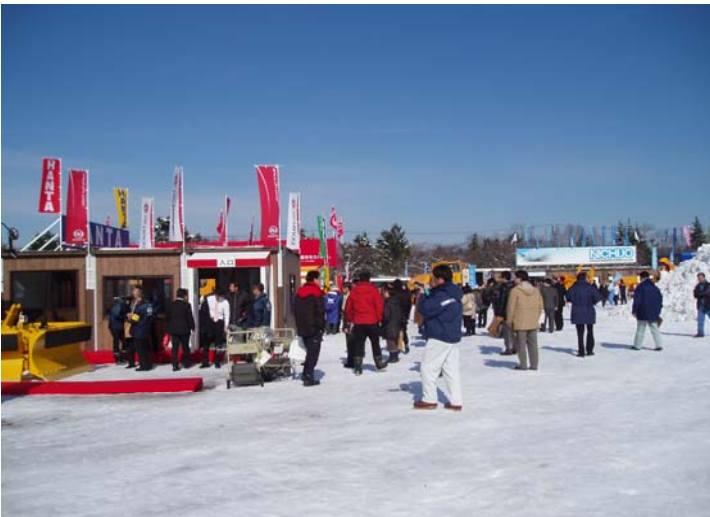
展示実演会場風景