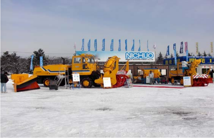
(株)日本除雪機製作所 会場展示品 多機能型ロータリ除雪車 ロータリ幅2.6m、プラウ、グレーダ付 250kw 小型除雪車 ロータリ幅1.5m 112kw 凍結防止剤散布装置 湿式1.5m 3