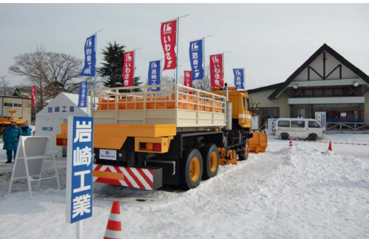
岩崎工業(株)展示品 除雪トラック 10t級 6×6 溶液袋積載型散布装置付き