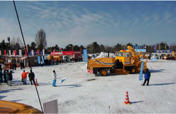
除雪機械実演会状況