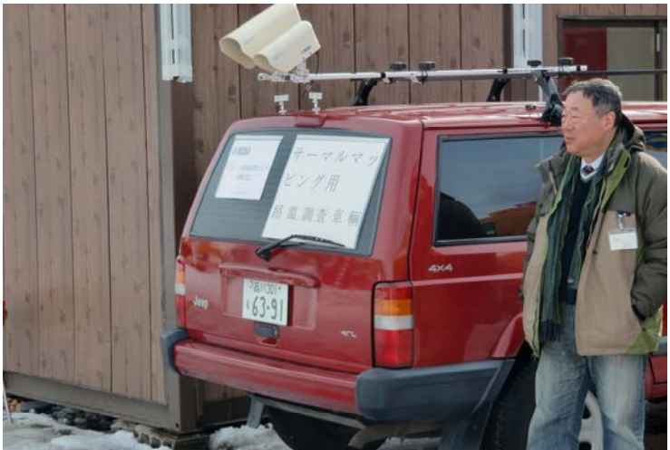
範多機械(株)・エアポートシステムズ会場展示品 モバイルリモート路面センサー