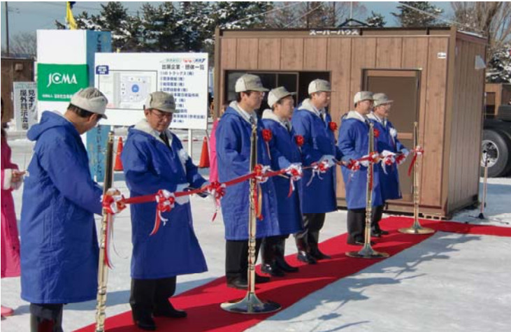
開会式でのテープカット風景 テープカット者(7名)