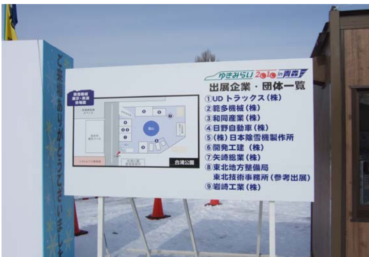
出展企業・団体配置平面図看板 (2100mm×1200mm) 8企業・1機関出展