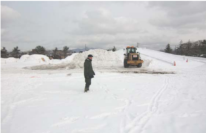
ゆきみらい2010in青森 「除雪機械展示・実演会」会場除雪風景