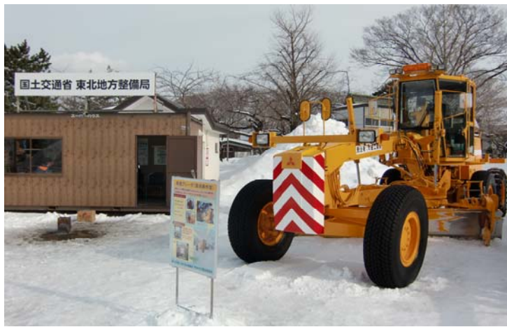
東北地方整備局会場展示品 除雪グレーダ 4.0m級 除雪トラック 10t級 4×4 凍結抑制プラウ付き