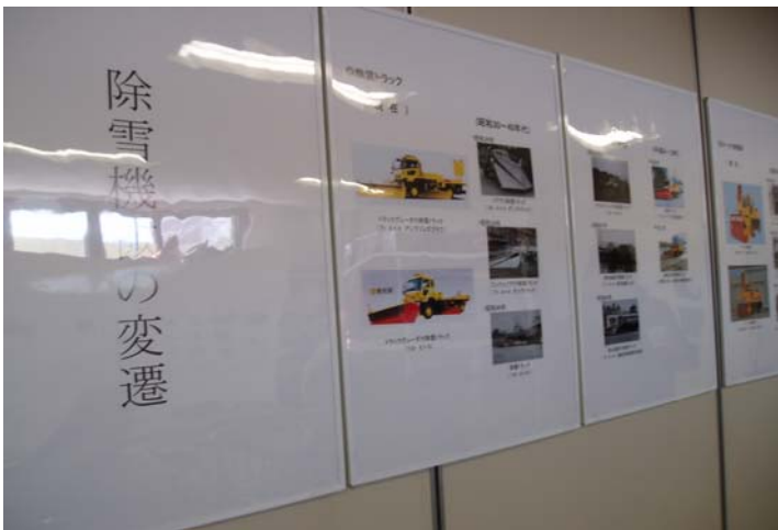
休憩所内の除雪機械写真展(除雪機の変遷) 除雪トラック、ロータリ除雪車、除雪グレーダ 除雪ドーザ、散布車、小型除雪車