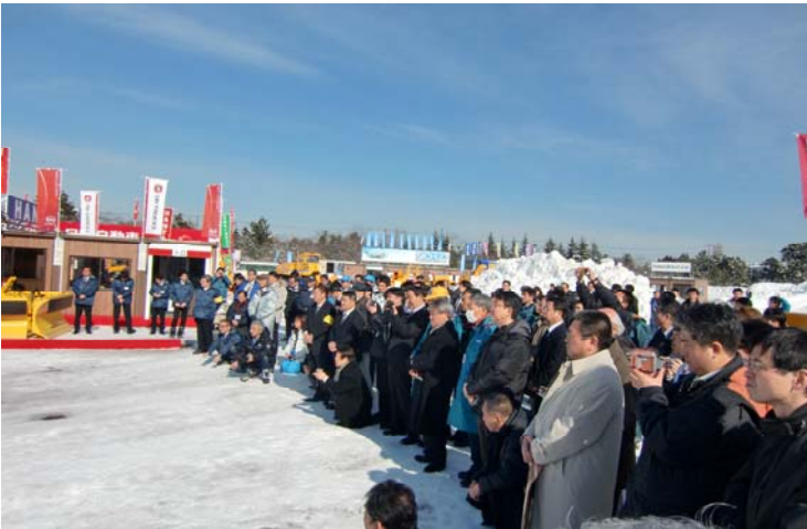
開会式 展示・実演会 開会あいさつを聞く見学者