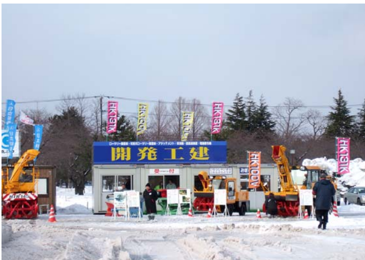
開発工建(株) 会場展示品 ロータリ除雪車 除雪幅可変型1.65m~1.87m 64kw 汎用プラウ 草刈装置 上記ロータリ除雪車用 ロータリ除雪車 幅1.0m、32kw