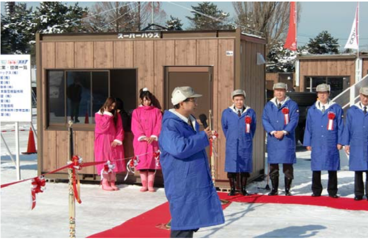
10:15~ 開会式風景 社会長 あいさつ