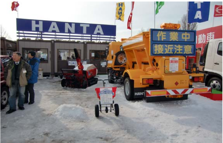
範多機械(株)会場展示品 凍結抑制剤散布車 2.5m 3 4×4 車両下回り洗浄機 手押し散布機 和同産業(株) ハンドガイドロータリ幅0.8m 15.3kw ハンドガイドロータリ幅1.2m 24.6kw