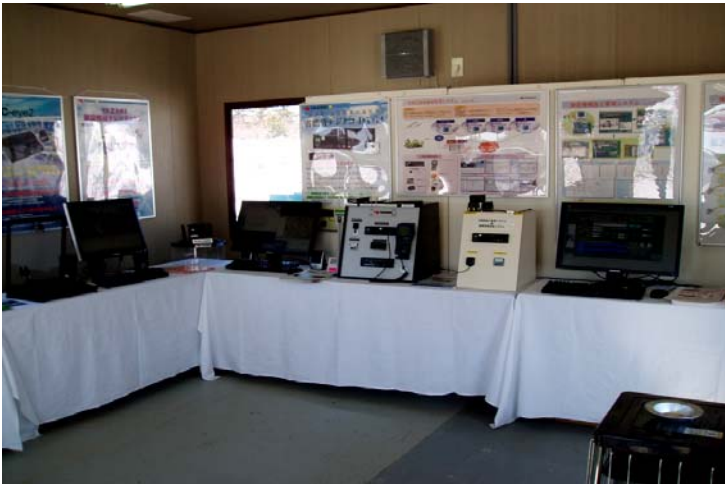
矢崎総業(株)会場展示品 (室内展示状況)