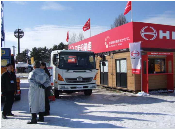
日野自動車(株) 会場展示品 凍結防止剤散布専用トラック 6t級4×4 範多機械製洗車装置装備