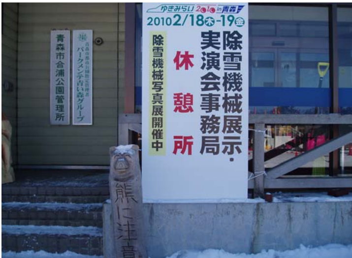
事務局、休憩所、除雪機械写真展案内看板 (休憩所で除雪機写真展開催)