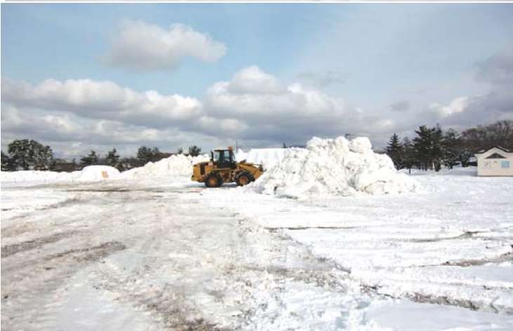
除雪実演用雪山造成