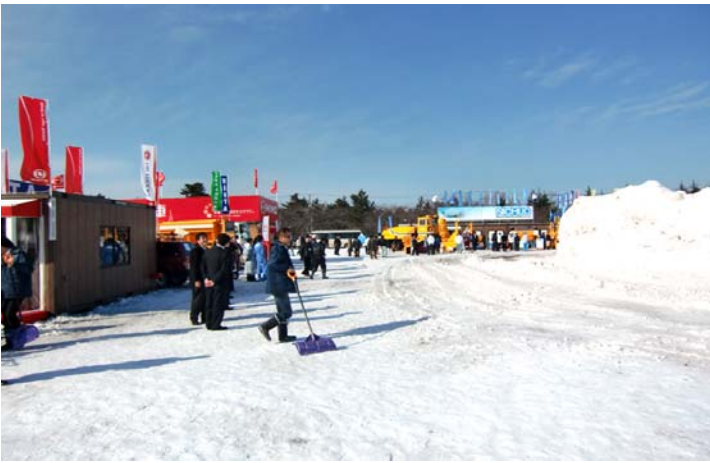
展示実演会場風景