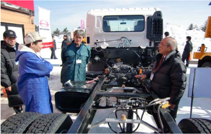
シャシ洗浄装置の説明を受ける見学者