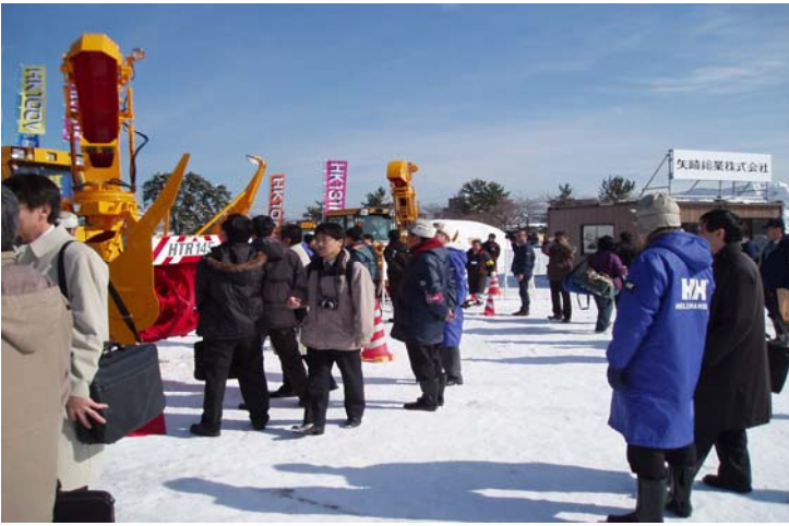
来場者の見学状況