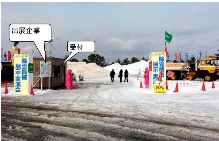
展示実演会場入り口・受付棟