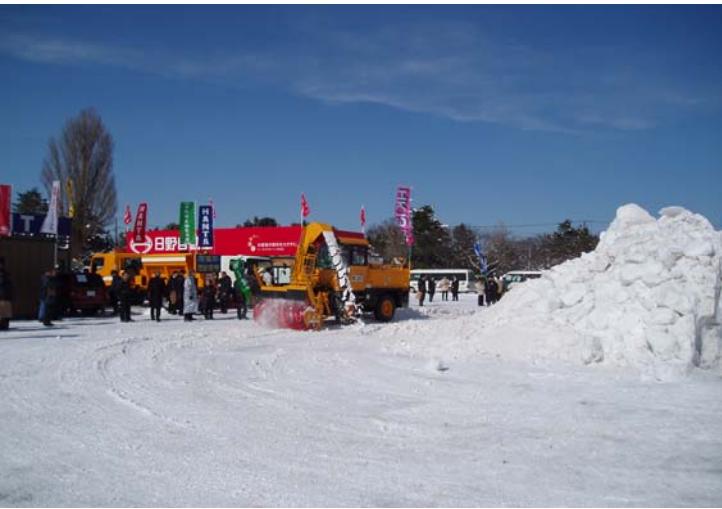
除雪機械実演会状況