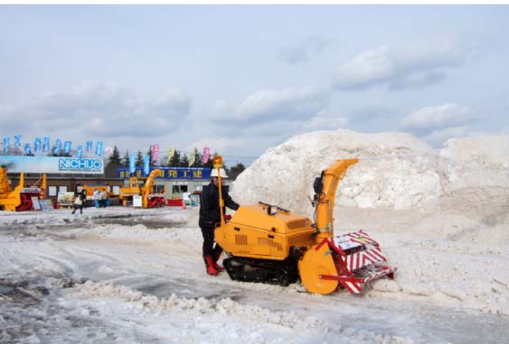
除雪機械実演会状況