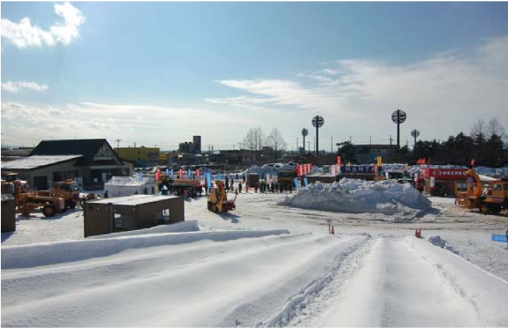
展示実演会場全景(2/2) 手前スロープは雪祭り時の滑り台跡 後日使用のため存知