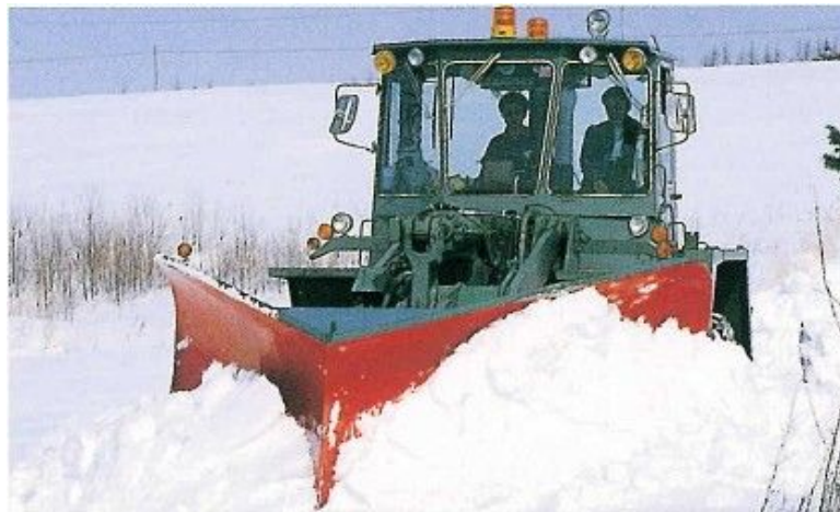
写真 Vプラウによる除雪作業中