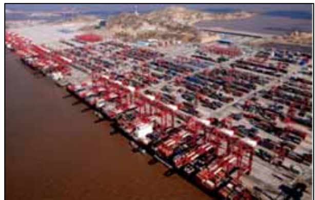
洋山深水港 埠頭(第一期工事分)