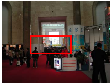
日本パビリオン(1号館入り口から)