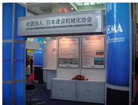
日本建設機械化協会