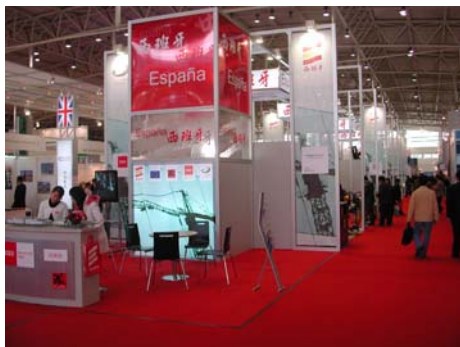
スペインパビリオン