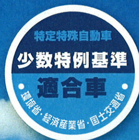
【少数特例基準適合車マーク】