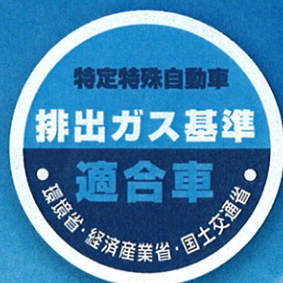
【排出ガス基準適合車マーク】