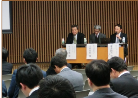
写真4 委員会活動について説明する推進本部の委員長とWG長