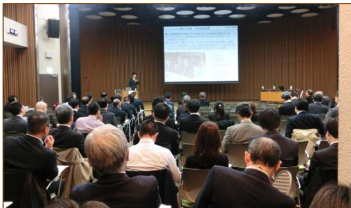
写真6 熱心に聴講する参加者

当日は、協会会員ほか約120名の参加をいただきました。特に国土交通省や国総研の発表に際しては、質疑対応もなされて i-Construction 施工に係る関心の高さが伺えました。