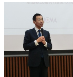
写真5 四家副推進本部長